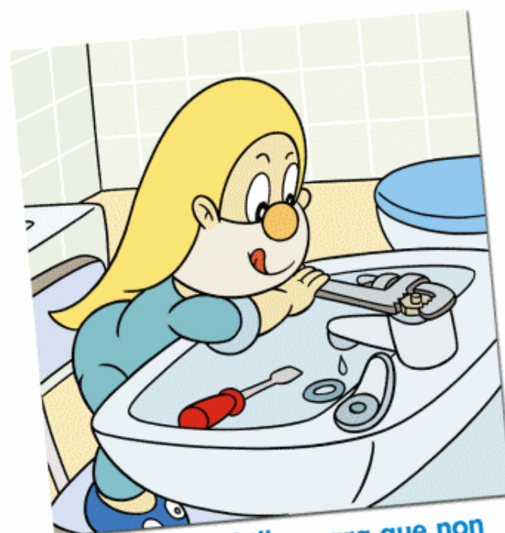
Amaña as billas para que non perdan auga.