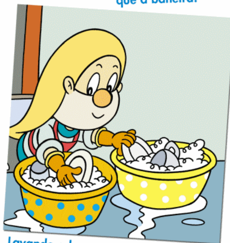
Lavando a louza en finas aforramos moita auga.