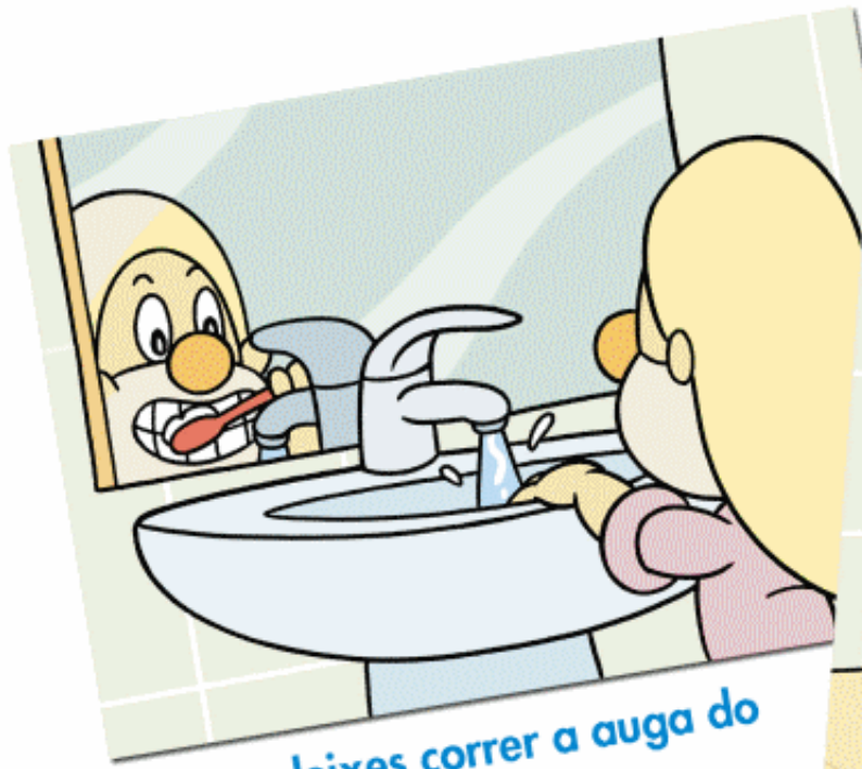
Non deixes correr a auga do lavabo.