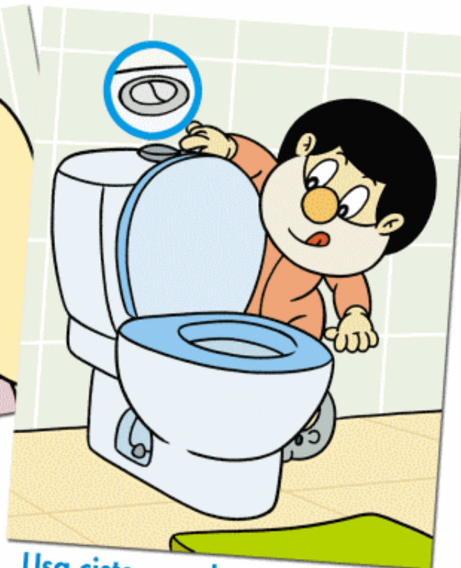
Usa cisternas de carga dupla.