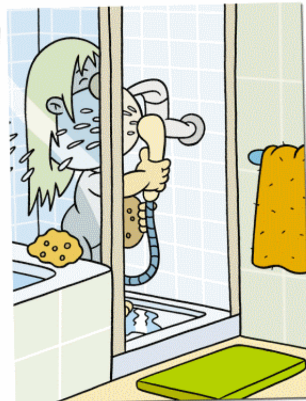
A ducha gasta menos auga que a bañera.