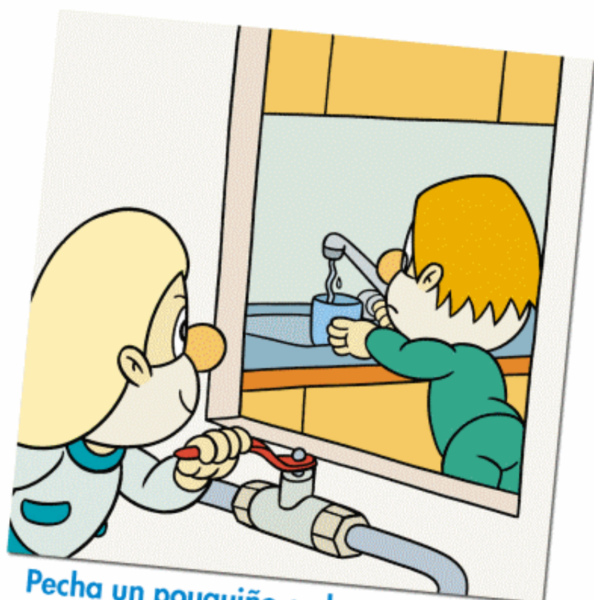
Pecha un pouquiño a chave de paso, para que saia menos cantidade de auga.