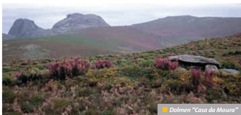
Dolmen "Casa da Moura"

Este itinerario forma parte de una nueva red de senderos de pequeño recorrido en el Parque Natural Baixa Limia-Serra do Xurés.