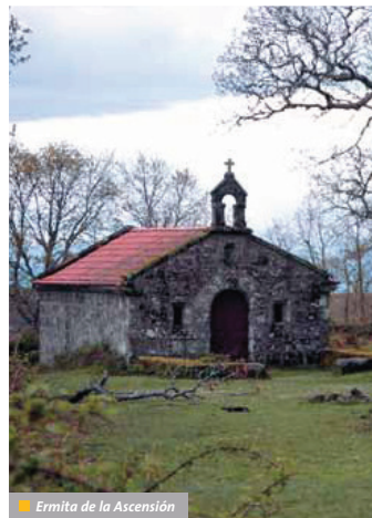
Ermita de la Ascensión